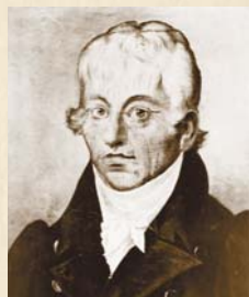
Karel Vyhnanek 1855–1861