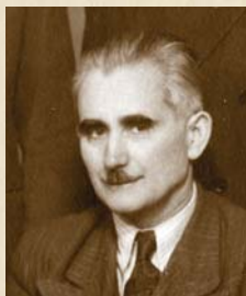
Břetislav Nedbal 1950–1957