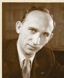
Jiří Kárný 1945