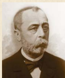
František Skácelík 1883–1889