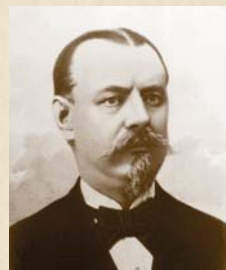
Jindřich Matzenauer 1874–1883