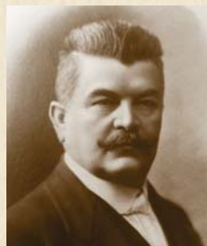
Matouš Havránek 1913–1919