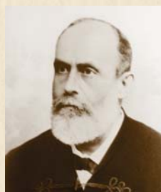
František Štěpka 1890–1896