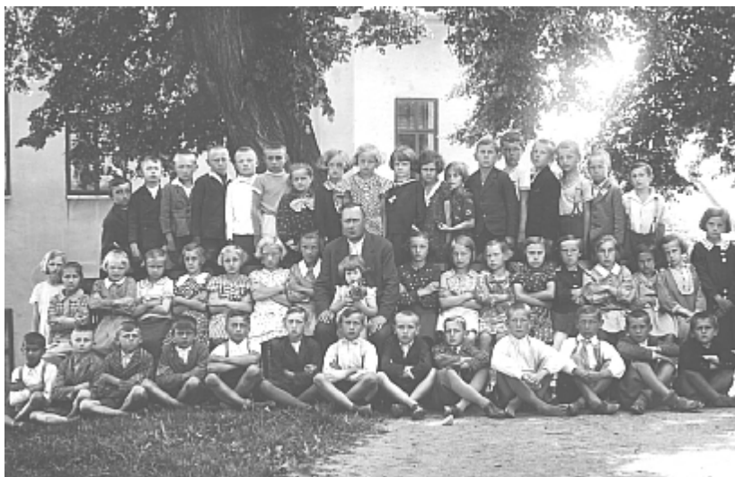
II.třída – červen 1935

O slava svátku Svobody dne 28. října provedena jako jiná léta způsobem tohoto významného dne důstojným. Společně s oslavou 28. října slaveno významné 50-ti leté jubileum budovy školní připadající právě na tento den. Slavnost započala o 6. hodině ranním budíčkem. O 1/2 10. hodině sloužena na přání zastupitelstev obcí Domaželic a Čech