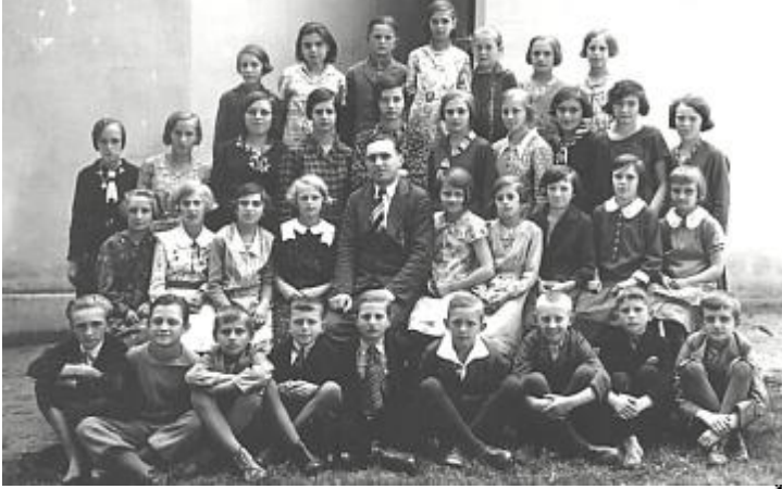
Žáci III. třídy 1933/1934

P ropouštěcí vysvědčení vydáno 9. žákům. Do měšťanských škol odchází 7 žáků, do reálného gymnásia 2 žáci.