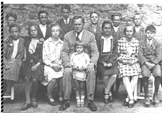
Žáci III. třídy 8. roku školní docházky