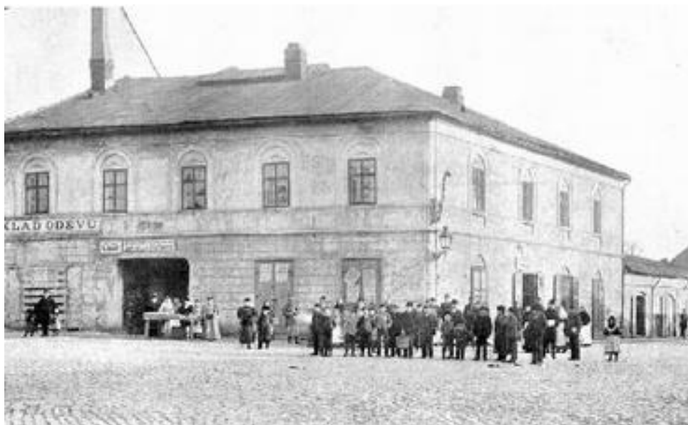
HOSTINEC U BÍLÉHO KONÍČKA. Se nacházel na rohu Dolního náměstí v místech dnešního Městského domu. Snímek je z konce 19. století, těsně před zbouráním budovy.