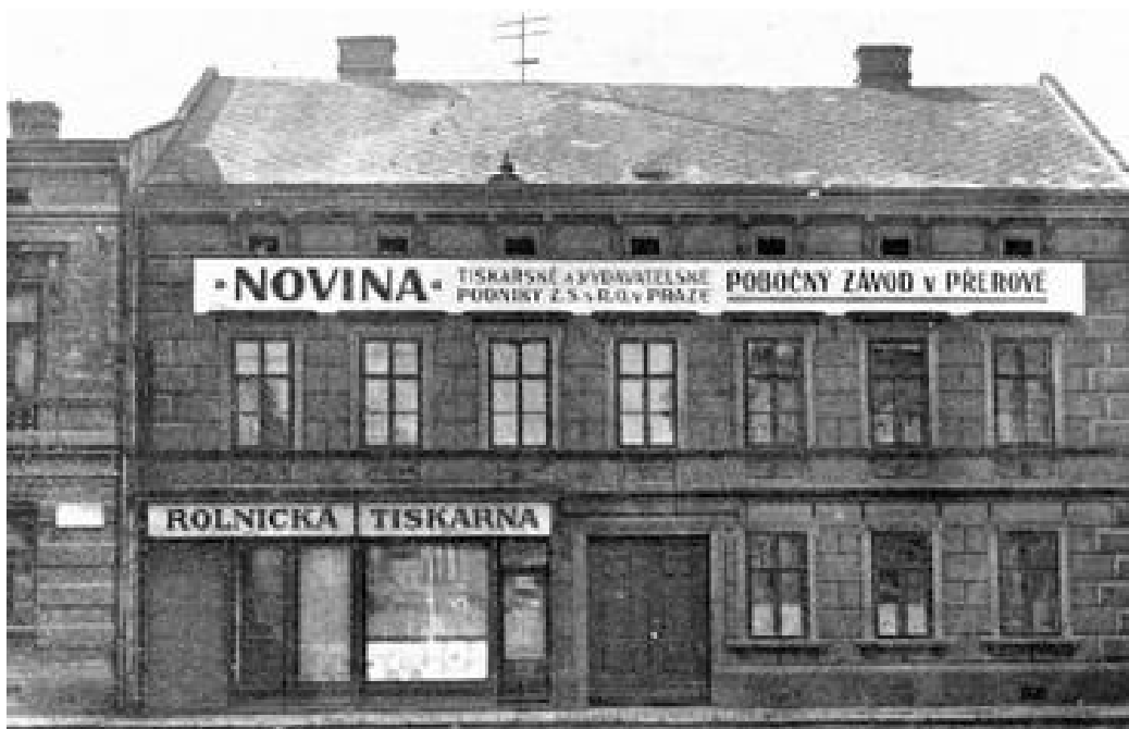
TISKÁRNA NOVINA. Předchůdcem tiskárny byla Rolnická tiskárna, která se v roce 1919 stala pobočným závodem Českomoravských podniků tiskařských a vydavatelských v Praze. Zaslal Jiří Lapáček

V roce 1906 byl zakoupen dům v Palackého ulici č. o. 12, a to za účelem pozdějšího přemístění tiskárny. Zatím zde v pronájmu fungovala tiskárna Bartheldý, později Strojil, který se po obdržení výpovědi v roce 1910 přestěhoval na Dolní náměstí do Kozánkova domu, takže si firmy vyměnily svá místa.