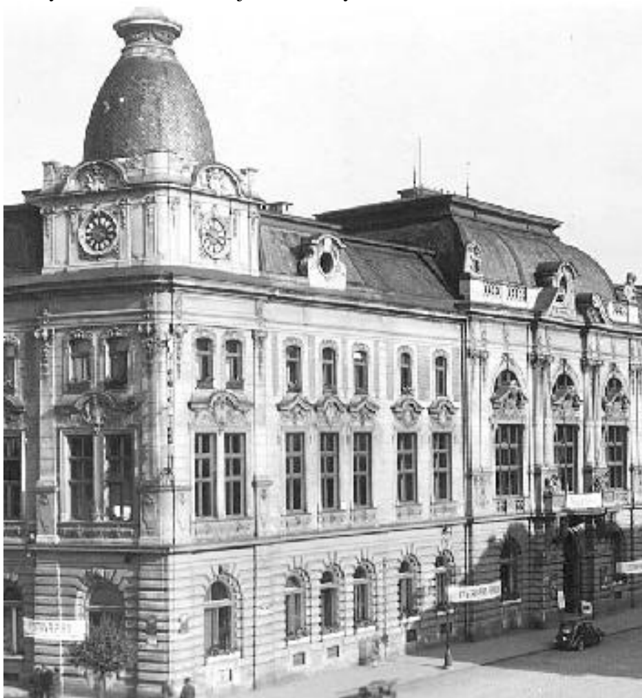
NA POČEST PREZIDENTA. Masarykova městská knihovna, která byla zřízena za 1. republiky. V současnosti Městský dům

Krátce po skončení 1. světové války, v době budování samostatného státu, kdy se kladly základy řady institucí, které slouží veřejnosti bez přerušení až dodnes, požádali mladí členové české státoprávní demokracie (později strana národně demokratická) na své schůzi 26. listopadu 1918 městskou radu, aby zřídila v Přerově místo samostatného knihovníka, který by měl na starost vybudování velké veřejné knihovny.