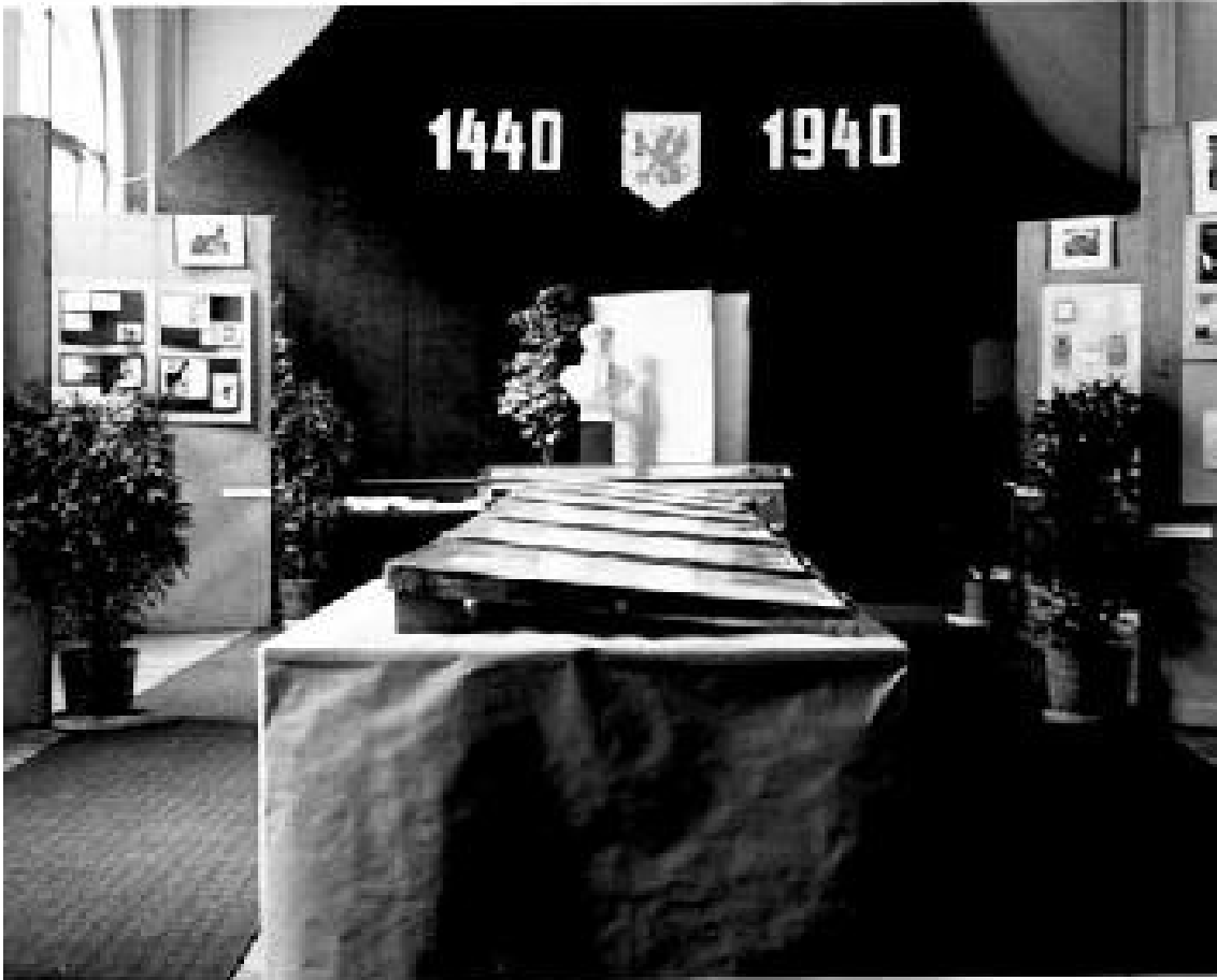
Po pěti stech letech Výstava k výročí objevení knihtisku, která se konala v roce 1940.

Podle stavu k 1. lednu 1937 knihovna obsahovala celkem 35 753 svazků, čtenářů bylo 33 906, jimž bylo půjčeno 81 146 svazků, v roce 1935 bylo návštěv čtenářů 35 514 a výpůjčky činily 85 418 svazků. Za dobu 15 let od roku 1932 vzrostla knihovna dvojnásobně, kdežto stav personálu zůstal nezměněn. Od roku 1938 se stupňovala opatření čelící válečné hrozbě. Z toho důvodu byl dán požadavek na zhotovení beden na uschování masarykian a jiných vzácných, památných a cenných knih, na pořízení zatemňovacího zařízení a plynových masek.