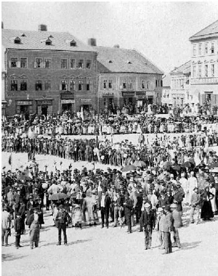
POHLED NA MASARYKOVO NÁMĚSTÍ. Na počátku 20. století, kdy vzniká nová veřejná lidová knihovna.