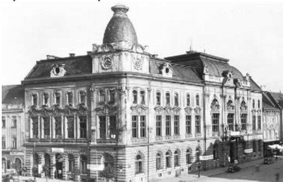
MASARYKOVA MĚSTSKÁ KNIHOVNA. Vzniká v období 1. republiky v budově dnešního Městského domu spojením veřejné knihovny a čtenářského spolku. Zaslal Jiří Lapáček

Vydáním zákona o knihovnách v roce 1919 si musely čtenářské spolky hledat nové pole působnosti. V případě Přerova to byla péče o veřejnou čítárnu. Vedle toho se spolek orientoval na půjčování literárních novinek členům. Po určité době pak byly odprodávány za sníženou cenu Masarykově knihovně. Samozřejmě zůstalo pořádání různých vzpomínkových akcí k literárním výročím.