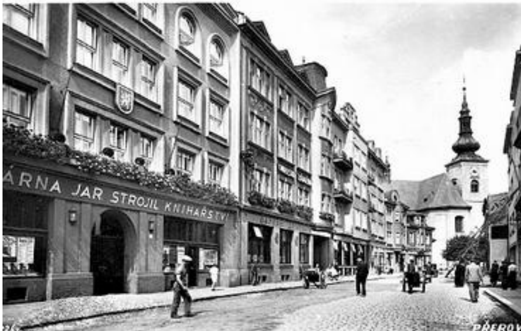
KNIHTISKÁRNA, KNIHAŘSTVÍ, KNIHKUPECTVÍ. V pořadí druhá nejstarší knihtiskárna v Přeřově vznikla na základě společenské smlouvy 13. ledna 1882. Zaslal Jiří Lapáček