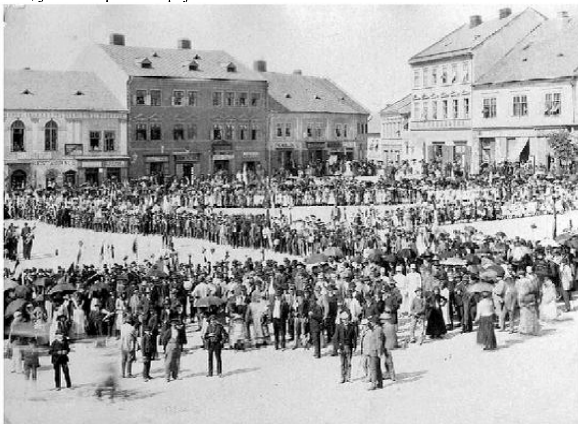
MASARYKOVO NÁMĚSTÍ V PŘEROVĚ. V roce 1890.

Za deset let bylo v knihovně půjčeno 602 476 svazků, prošlo tudy 263 340 návštěvníků, což bylo provedeno v 78 700 půjčovacích hodinách. Průměrně za hodinu bylo vyhověno 37 osobám, jimž zase přibližně půjčeno 90 knih. V knihovně se nacházelo 30 000 svazků.