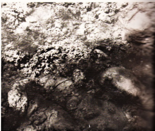
Exhumace těl v Lazcích u Olomouce (NA)