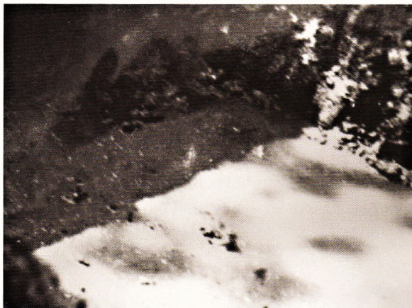
Společný hrob v Lazcích u Olomouce po exhumaci (NA)