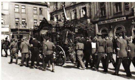
Pohřeb obětí (AA)