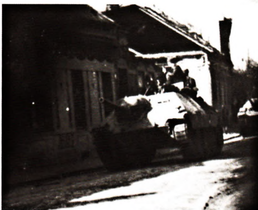
Nacistické vojenské jednotky v Kozlovské ulici (AJR)

affen-SS, kterou přivezl obrněný vlak z Olomouce. Město bylo z okolí ostřelováno i z těžkých raní. Na všech důležitých křižovatkách a strategických místech byly zřízeny opěrné body německých jednotek.