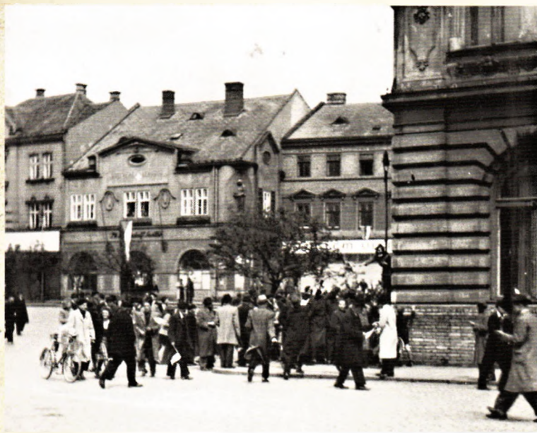
Srocení davu na Dolním náměstí (dnešní náměstí TGM), Přerov, 1. května (AJR)