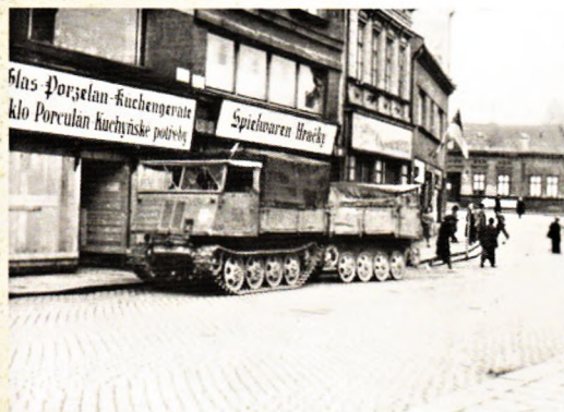
Německé vozidlo na Žerotinově náměstí během přerovského povstání (AJR)