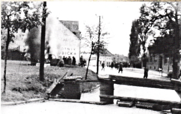
Přerovské povstání (AJR)