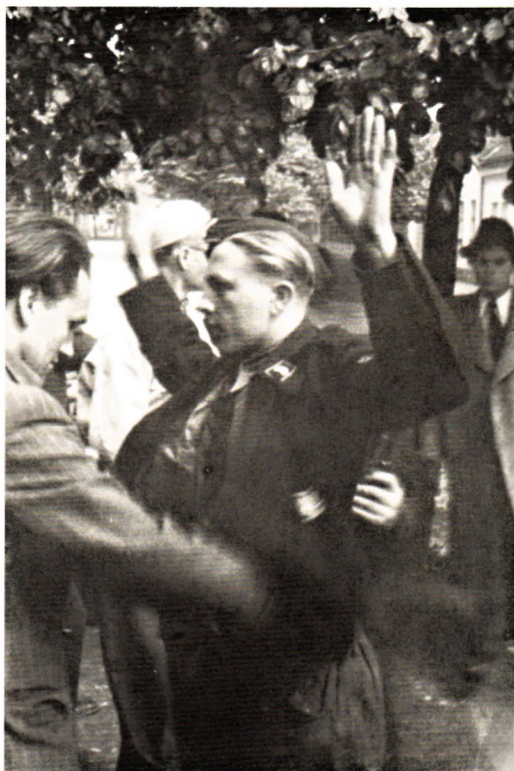
Odzbrojování v Želatovské ulici (AJR)