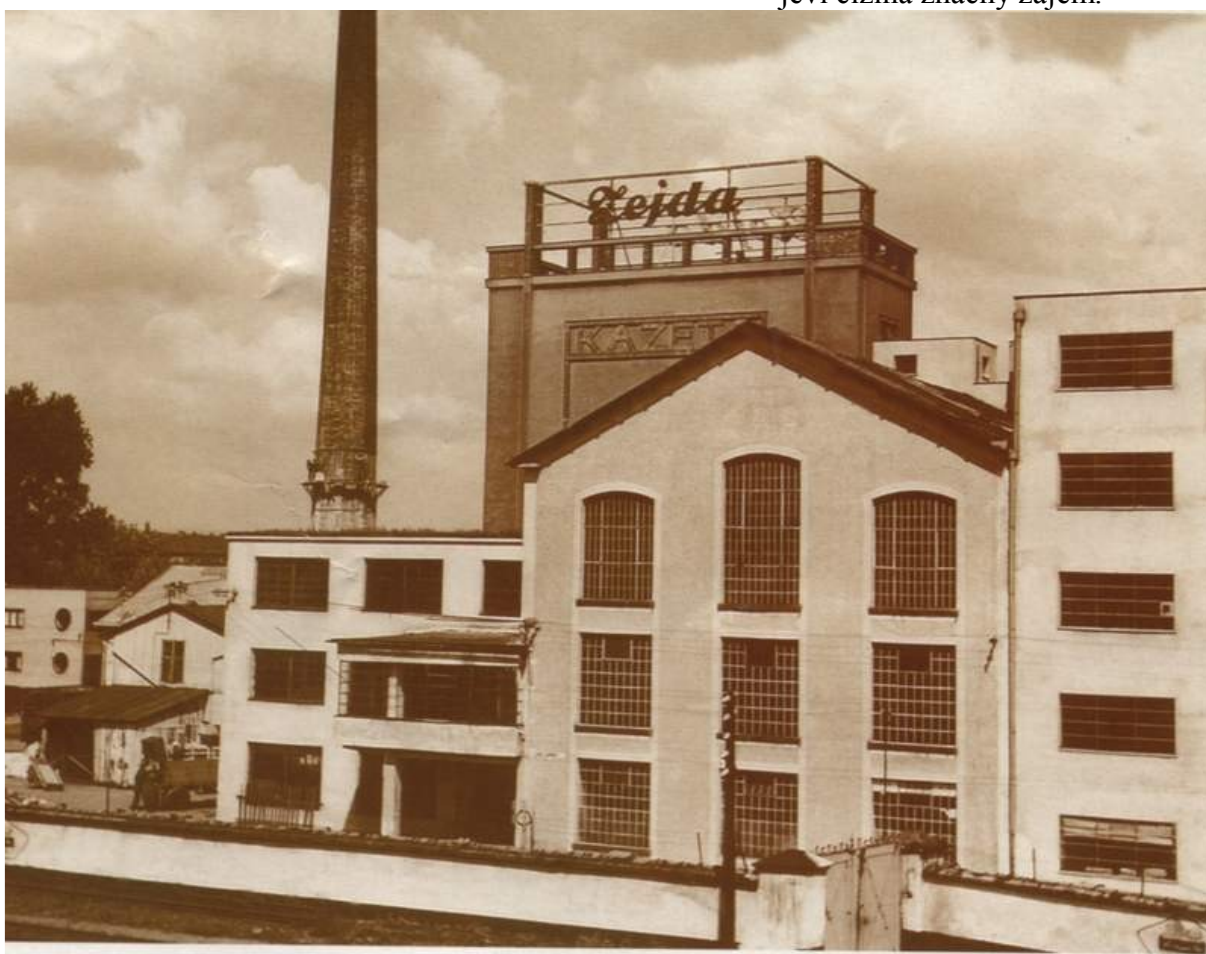
Kazeto - třicátá léta

Dnes (1932 ) zaměstnává továrna 150 zaměstnanců, jest největší továrnou toho druhu v ČSR, vyrábí denně až 1500 kufrů a 500 kg vulkanfibru vedle veškerých ostatních polotovarů, kterých k výrobě jmenovaného množství kufrů jest zapotřebí. Továrna jest zařízena tak, že je schopna krýti sama celou tuzemskou spotřebu a jest na programu, po urovnání hospodářských poměrů světových věnovati se také expertu, jelikož o výrobky firmy K. Zejda jeví cizina značný zájem.