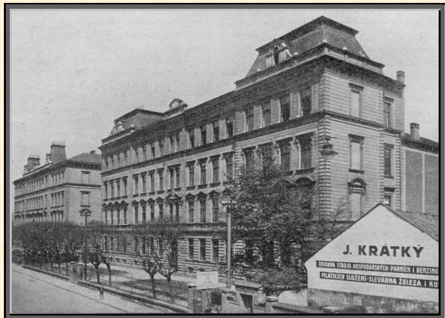
Obecné a měštanské školy v Palackého ulici

Vydatnou pomocí školním dětem, zejména sociálně slabším, jsou okresní péče o mládež, dvě pro soudní okres přerovský a kojetský. Pro zlepšení osudu mládeže ve školním okrese přerovském konají práci neocenitelnou. Starají se, aby zdraví mládeže bylo na nejvyšším stupni, pečují o stravování a ošacování školáků, o děti nemanželské a v cizí péči, o sirotky, o nemluvnata, vydrží poradny pro matky a okresní poradnu pro volbu povolání (za r. 1932 ji vyhledalo 157 žáků čtrnáctiletých a desítiletých). Činnost obou okr. péčí o mládež si vyžádá každoročního nákladu asi čtvrt milionu Kč, z čehož jen asi čtvrtinu až třetinu poskytnou veřejní činitelé. Jinak se počítá s dobročinností veřejnosti, též školního zactva. Starost o zdar těchto