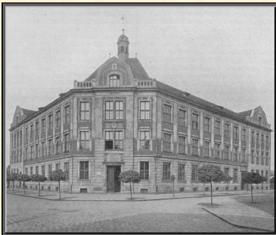
Bývalé pedagogium, nyní škola Boženy Němcové

Kromě školní své práce koná učitelstvo okresu obětavě také tradiční práci lidovýchovnou, a to nezištně, nežádajíc a nedostávajíc odměny. Práce v tělocvičných jednotách, v místních osvětových komisích