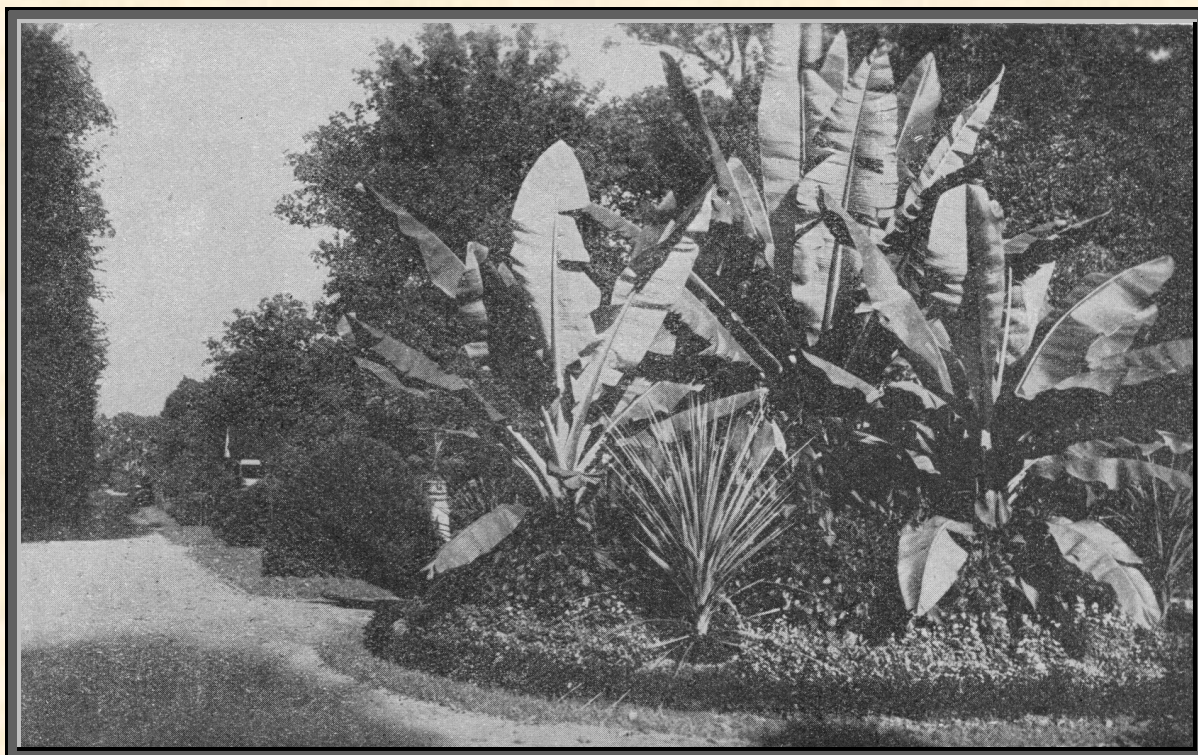
Partie ze sadu Michalova

Až bude uskutečněno vybudování samostatné budovy pro veřejnou odbornou školu pro ženská povolání - jak je má v plánu město Přerov - pak jistě otevřou se brány novému rozvoji školy, jež má nejlepší snahu svědomitostí své práce a účelným a promyšleným zařízením vésti naše ženy k lepším zítřkům.