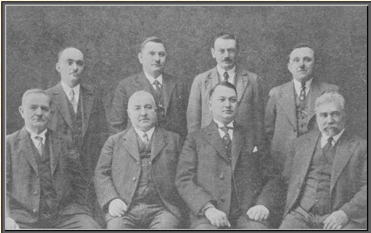
Obecní rada městečka Brodku

Brodek u Přerova vznikl na místě, kde vedla již r. 1086 připomínaná starodávná obchodní cesta, která spojovala bývalé hrady Olomouc s Přerovem. Potok Kokořka (Olešnice) rozléval se zde široko na nížinách a tvořil tu nebezpečné mokřiny a bařiny (doposud traťový název pozemků), kterými se dřívější cestující museli brodit; odtud pochází patrně název obce. O vzniku obce není dosud dokumentární jistoty. Jedna tradice tvrdí, že Brodek byl původně zájezdní hospodou při obchodní cestě. Již v roce 1364 platil klášter sv. Kateřiny Vektorovi za Brodek z lánu a křemý po půl groši. Druhá báje jest sice pohádkovější (opírá se o název pozemků „Na zámečku“), avšak méně pravděpodobnější. Tvrdí, že Brodek byl původně hrad nebo zámek. Pro historiky naskytuje se tu zajímavý předmět vděčného studia. Dnes jest jisté pouze to, že tu dříve býval panský dvůr, který byl později rozparcelován (před r. 1788) a že obec Brodek jest též jmenována mezi obcemi, které byly povinny zemskou robotou pracovati při opevnění hradu a města Přerova.