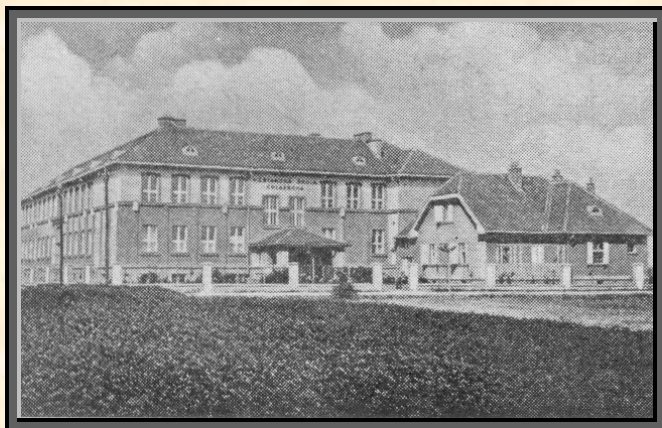
Nové budovy škol v Brodku