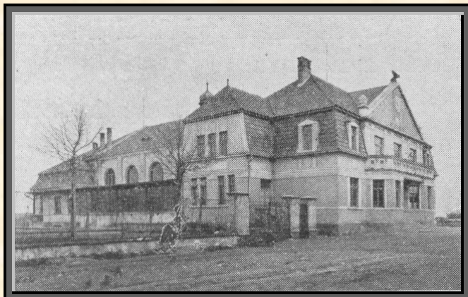
Sokolovna v Brodce

Z peněžních ústavů jsou v Brodce: Rolnická záložna (1869) a Spořitelni a záloženský spolek,